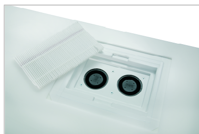
łatwy w utrzymaniu czystości